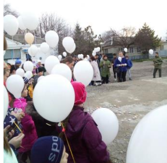
Акция « Подарок солдату»